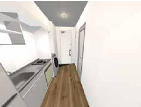
■ キッチンイメージ図